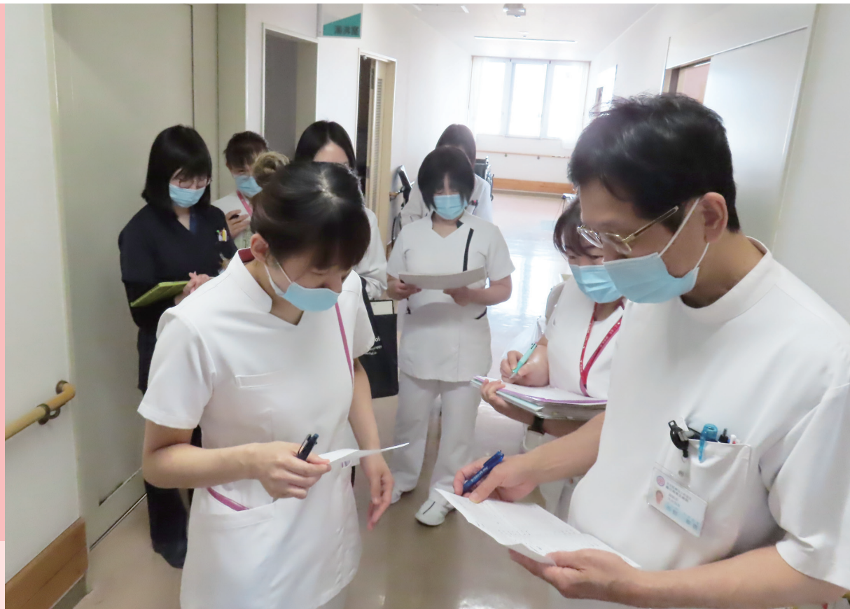
〈写真：褥瘡対策委員会による回診の様子〉 詳しくは3ページをご覧ください。