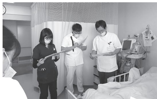
医師と各職種の委員が回診を行っています